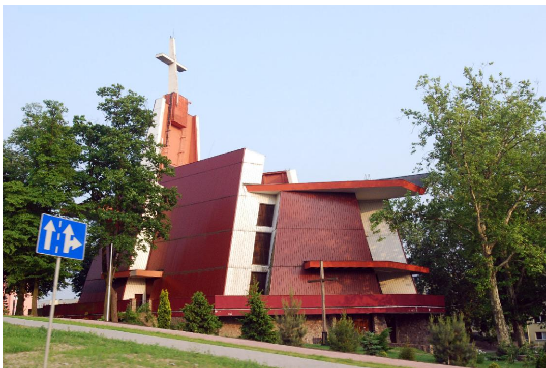
Rys 3 Budynek domu parafialnego Parafii Rzymskokatolickiej pw. Miłosierdzia Bożego w Szczecinie